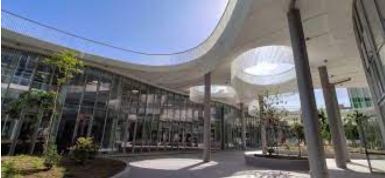
Università degli Studi Roma Tre