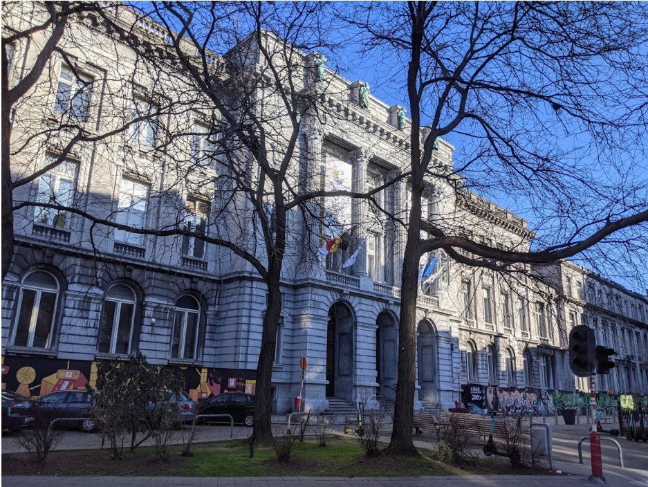
Université de Liège, Belgien