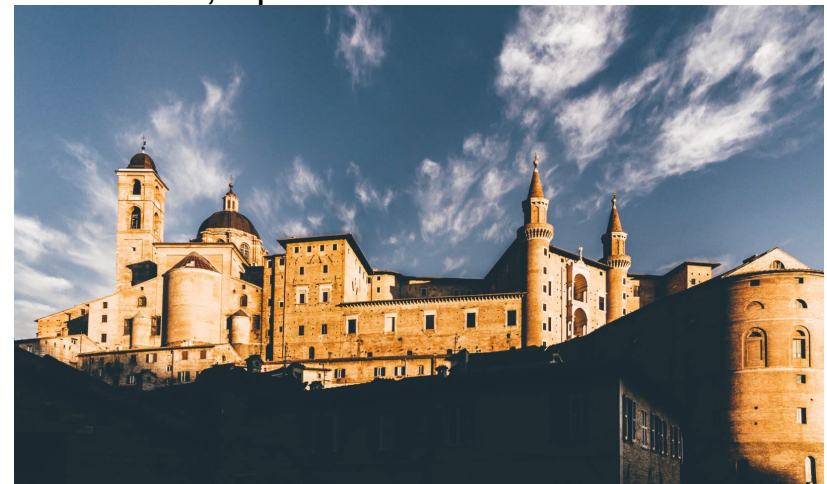
Università degli Studi di Urbino Carlo Bo