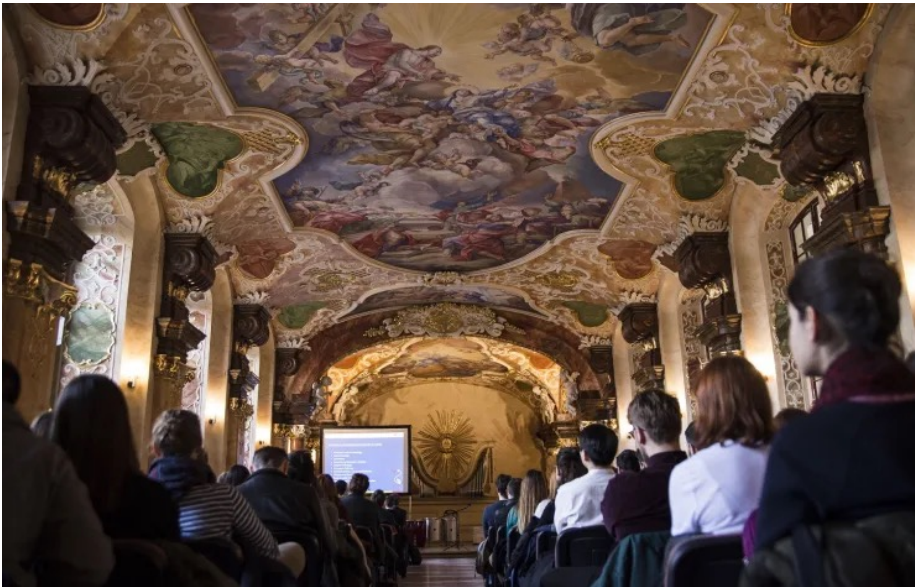
Uniwersytet Wrocławski, Polen